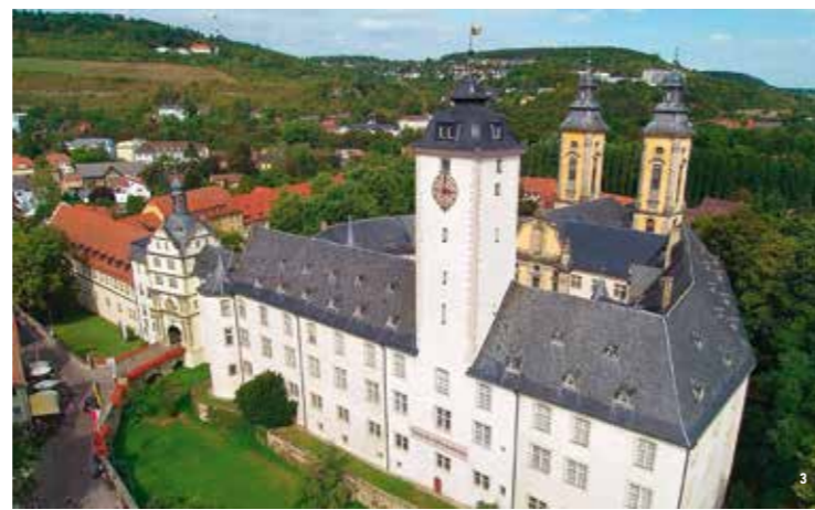
👑 Schloss Mergentheim von der Stadtseite