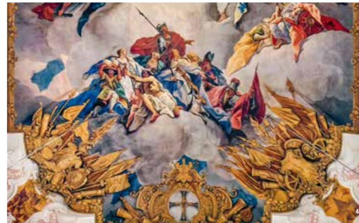
👑 Ausschnitt aus dem Deckenfresko von Nikolaus Stuber aus dem Jahr 1735 in der Schlosskirche

Die erste Sektion befasst sich mit der mittelalterlichen Frühphase der Deutschordenskommande Mergentheim. Wurden dort bereits die Grundlagen für den Aufstieg der Kommende zum bedeutenden Zentralort des Deutschen Ordens geschaffen? Ausgehend von der Auseinandersetzung mit dem allgemeinen Typus Residenzstadt, wendet sich die zweite Sektion der Stadt Mergentheim zu und untersucht, wie sich der Residenzstatus auf die Stadtentwicklung mit ihren Institutionen, ihrer Stadtverwaltung und Armenfürsorge auswirkte. In der dritten Sektion wird das Schloss mit seinen Nutzungskonzepten und besonderen repräsentativen Qualitäten in den Blick genommen. Neben den künstlerisch-architektonischen Höhepunkten, wie den Treppen der Nachgotik und den Fresken der Schlosskirche, wird auch die Rolle der handelnden Personen (Auftraggeber, Künstler, Komponisten, Architekten etc.) berücksichtigt. Während sich die vierte Sektion der konfessionellen Krise des Ordens einerseits und dessen kaiserlichem Glanz andererseits zuwendet, zeigt die letzte Sektion vergleichende Perspektiven zu anderen wichtigen Ordensniederlassungen im Reich auf sowie in Preußen und Livland, wodurch die Bedeutung der Mergentheimer Residenz besser eingeschätzt werden kann.