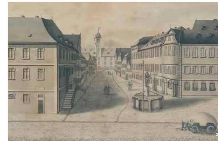
👑 „Ansicht des Schlosses von der Burgstrasse Mergentheim“, um 1820/30