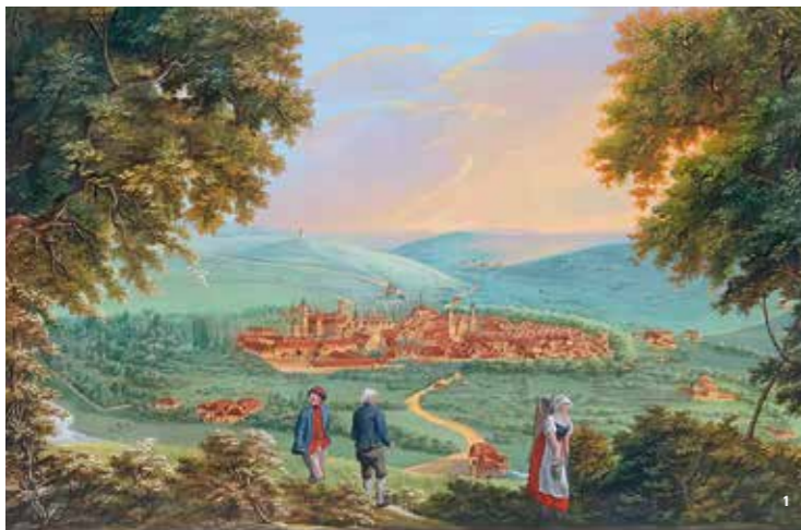
👑 Georg Joseph Gisser, „Ansicht der Stadt Mergentheim, von Norden gegen Süden“, um 1813